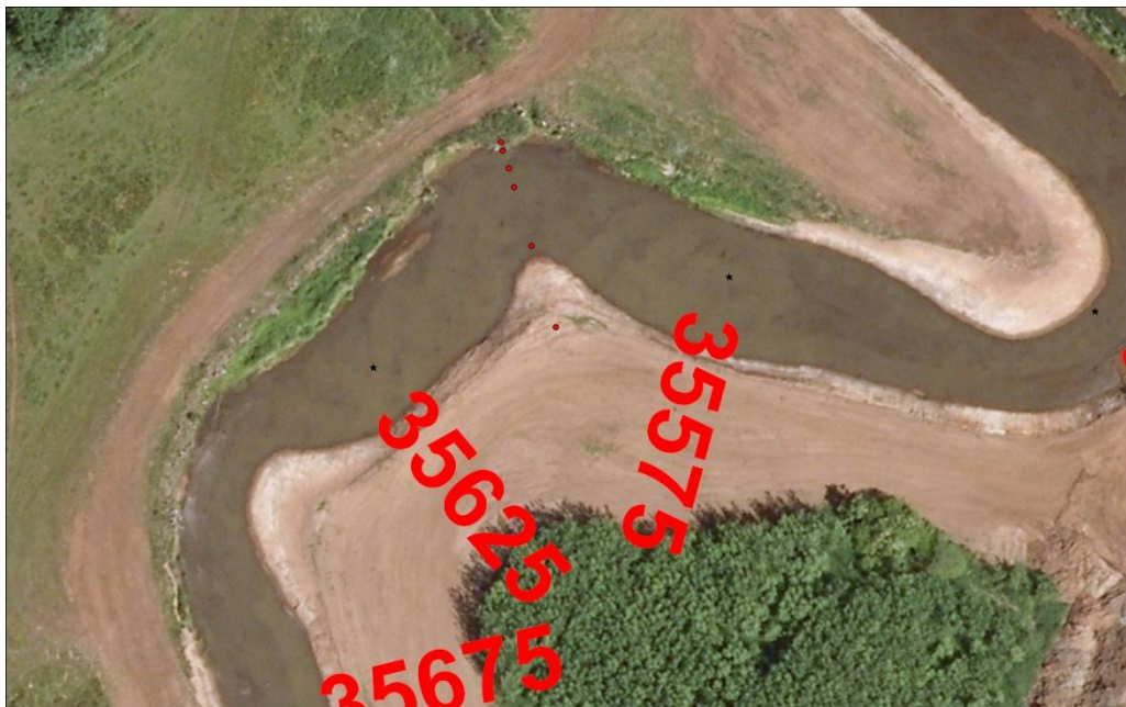
Figur 2.1: Opmålt tværprofil i st. 35616 (røde prikker). Eksempel på kontrolprofil opmålt på overgangen mellem en lige strækning og et sving. Baggrund: luftfoto 2010.

Der findes dog nogle profiler, der kræver lidt forklaring. Det skal bemærkes, at Varde Å på lige strækninger er projekteret med en bundbredde på 14 m, mens den i slyng er projekteret med skæve svingprofiler med stejlt anlæg i ydersvinget og fladt anlæg i indersvinget. Nogle kontrolprofiler er opmålt på overgangen mellem en lige strækning og et slyng, hvorfor det etablerede profil nogle steder er en hybrid mellem de 2 profiltyper, der således er dårlig sammenlignelig med de projekterede profiler for lige eller slyngede strækninger. Dette problem forekommer i tværnittene i st. 35616, st. 35904, st. 44509, st. 45130, st. 48803 og st. 49158. Eksempel på et tværprofils placeringer er vist i figur 2.1.